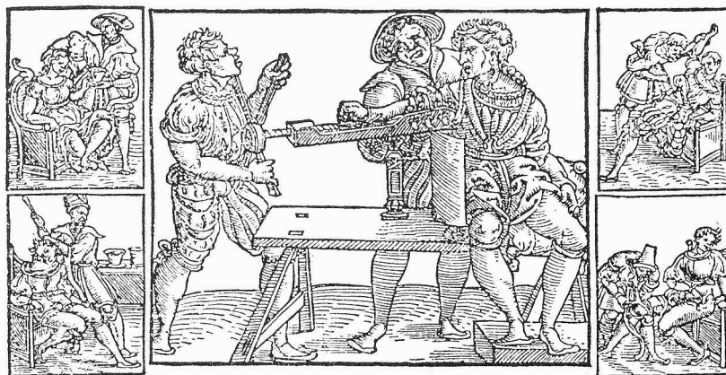
Een zeer vroeg voorbeeld van Nederlandse wetenschappelijke illustratie. Uit: Hieronymus Brunschwig, Dat hantwerck der chirurgien . Utrecht, Jan Berntsz., 1535. Te zien in 's GRAVENHAGE.

LEUVEN Universiteitsbibliotheek: Uitgelezen, ingewijd . 17 oktober - half november 1986. Tentoonstelling van handschriften, oude drukken en boekbanden uit eigen bezit, n.a.v. de opening van vernieuwde lokalen. Geen catalogus.